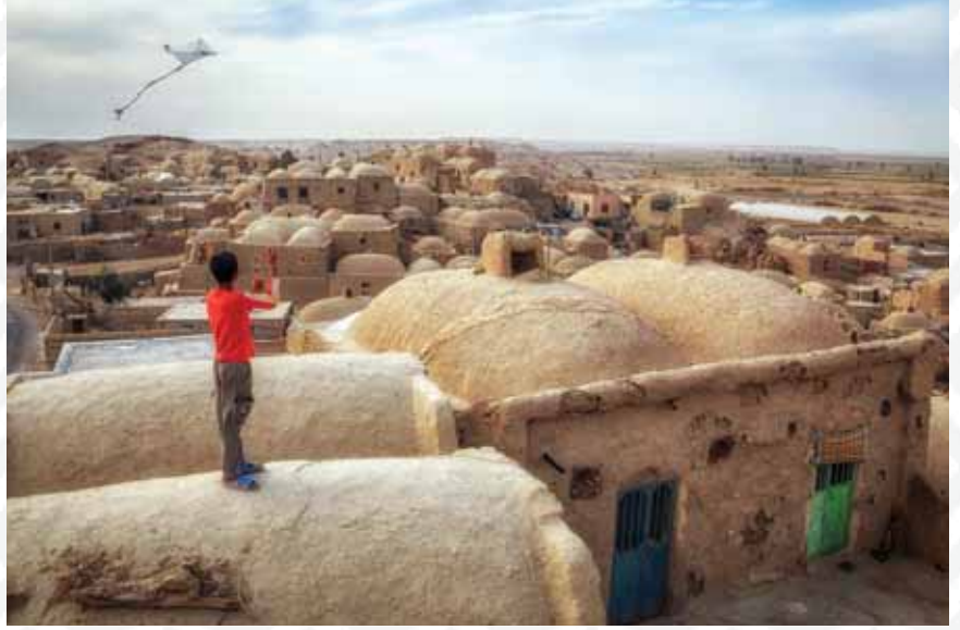
امیر حسین کمالی